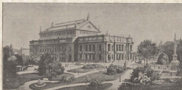
Teatro Colón, de Buenos Aires, Argentina

Está situado en la Plaza Lavalle y puede contener 3,570 espectadores.